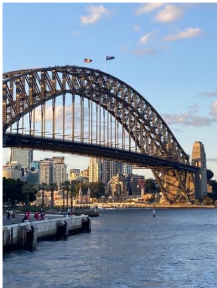
Figure 1 Sydney Harbour