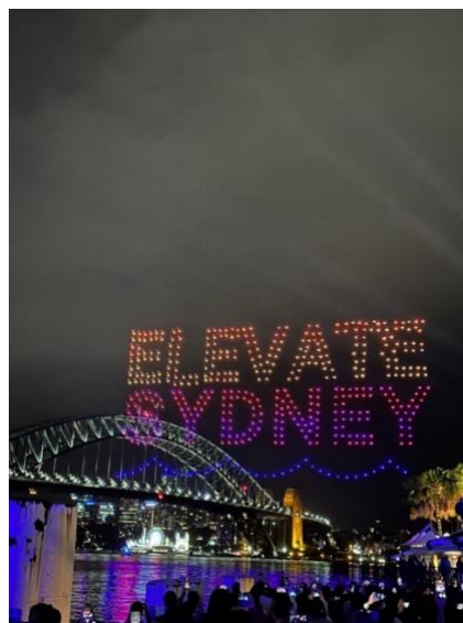
Figure 4 Dronen-Show in Sydney