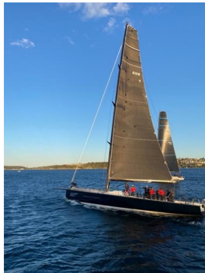
Figure 2 Segel Trip an der East-Coast