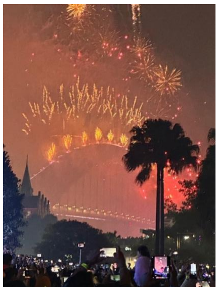
Figure 3 New Year Firework in Sydney