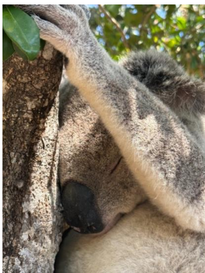
Figure 5 Koala auf Magnetic-Island