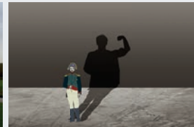
Fotografien und Kalendergestaltung: Anja Klemm, Berna Hamutcu, Sandro Wolf

Duale Hochschule Baden-Württemberg Stuttgart Studiengang BWL-DLM / Medien, Vertrieb und Kommunikation Theodor-Heuss-Str. 2, 70174 Stuttgart http://www.dhbw-stuttgart.de/muk